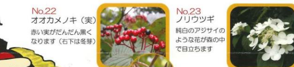
No.22 オオカメノキ (実) 赤い実がだんだん黒くなります (右下は冬芽) No.23 ノリウツギ 純白のアジサイのような花が森の中で目立ちます