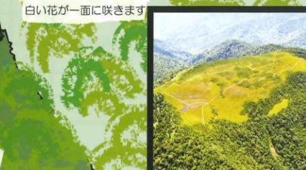
No.13 オサバクサ 白い花が一面に咲きます