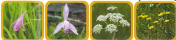
No.14 サワラン 赤紫色の花はつぼんだ状態で咲いています No.15 トキソウ 朱鷲が飛んでいるような姿の花です No.16 シラネニンジン 小さな白い花が集まった花火のような花です No.17 ミズギク 秋の湿原を代表する花です。鮮やかな黄色が目を引きまます