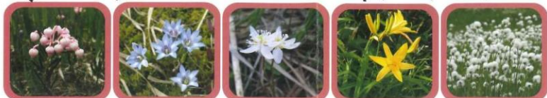
No.1 ヒメジャクナゲ 湿原に咲く小さなジャクナゲの花です No.2 タチヤマリンドウ 青紫色の花ですが、まれに白色やピンク色が咲きます No.3 ミツバオウレン 星型の白い花に三つ葉の葉っぱが特徴です No.4 ニッコウキスゲ オレンジ色の花が数日ごとに咲きかわります No.5 ワダスゲ (果穂) ふわふわの綿毛の根元に種子がついています