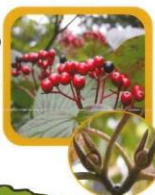
No.22 オオカメノキ (実)