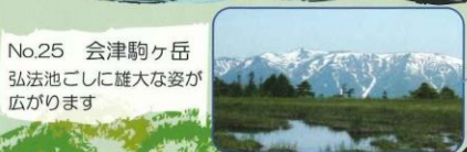
No.25 会津駒ヶ岳 弘法池越しに雄大な姿が広がります