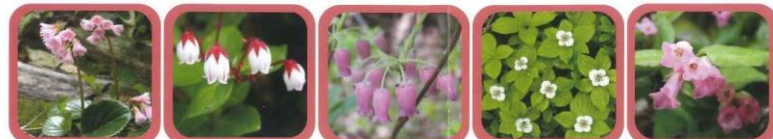
No.6 イワカガミ つやつやの楕円形の葉っぱが名前の由来です No.7 アカモノ 薄桃色の花が下向きに咲き、秋には赤い実がなります No.8 ウラジロヨウラク 赤紫色の鈴のような形の花です No.9 ゴゼンタチバナ 6枚葉っぱがついている株にお花が咲きます No.10 イワナシ 地面を這うように咲くピンク色の花です