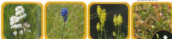
No.18 イワショウブ 花の茎がねばねばしているのはアリなどをよせつけないためです No.19 エソリンドウ 秋の湿原を代表する青紫色の花です No.20 キンコウカ 鮮やかな黄色で湿原を生きつめたように咲きます No.21 モウセンゴケ 食虫植物でトンボなどがよく捕まっています