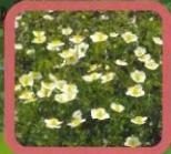
No.12 チングルマ (花)